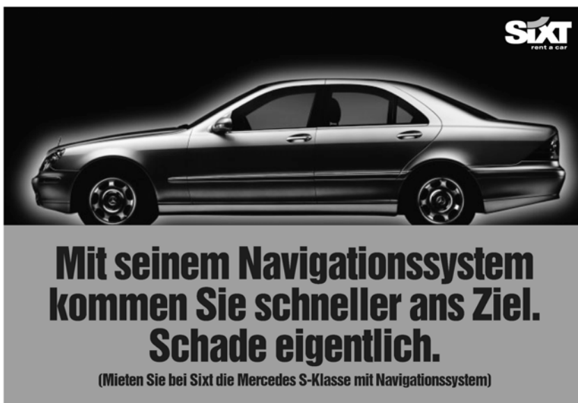
Durch Stilstrenge zum Erfolg: Autovermieter Sixt

und die zweithöchste Kaufbereitschaft. 45 Ein Beispiel für Werbung mit Schlüsselbildern aus dem „Ideenkreis“ der Marke ist der Autovermieter ‚Sixt‘. ‚Sixt‘ schaffte es, mit einer einzigartigen Farb- und Fotoauffassung aus jedem ‚Mercedes‘, ‚Porsche‘ oder ‚BMW‘ ein unverkennbares ‚Sixt‘-Mobil zu kreieren. Nicht zuletzt aufgrund dieses klar definierten Auftritts, der kontinuierlich kommuniziert wurde, konnte sich das Unternehmen zum größten Autovermieter Deutschlands entwickeln. Dabei war die Werbung trotz der Vorgaben keinesfalls langweilig, sondern variierte das Thema mit originellen Sprüchen.