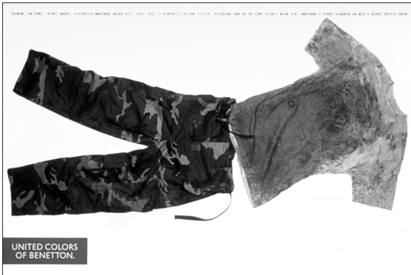
Kundschaftsirritation durch Provokation: „Bosnischer Soldat“ von Oliviero Toscani © Oliviero Toscani für United Colors of Benetton (Konzept und Foto)

Kauf zu überreden ...“, schrieb er in seinem Buch „Die Werbung ist ein lächelndes Aas.“ 43