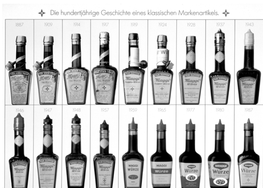
Die Evolution der Maggi-Flasche: Erneuerung und Tradition in optimalem Verhältnis

Verändert die Marke sich jedoch überhaupt nicht, wird sie von besser an die Umwelt angepassten Marken-Systemen verdrängt. Bei der selbstähnlichen Markenführung muss der Anteil des Gewohnten und Vertrauten wesentlich höher sein als der der Veränderung. Selbstähnliches Marken-Wachstum sollte, wenn man es in Zahlen ausdrücken will, aus 80 % Tradition und 20 % Innovation bestehen, wobei die Erneuerung immer an das Grundmuster der Marke anknüpfen muss. 18